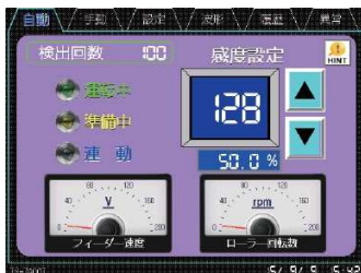
操作部(カラータッチパネル)